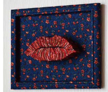
山本 圭子 B Yamamoto Keiko