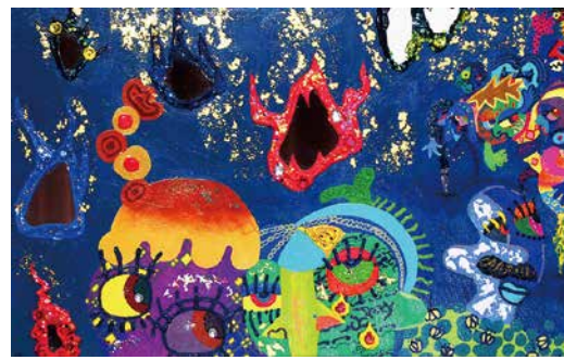
カズリ D 6F KAZURI