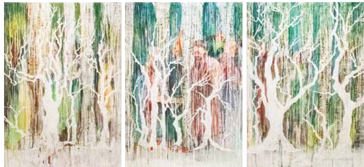
石原 葉 A Ishihara Yo