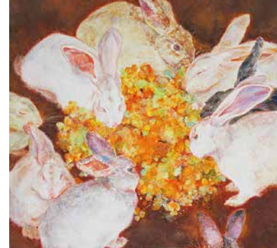
藤本 桃子 B Fujimoto Momoko